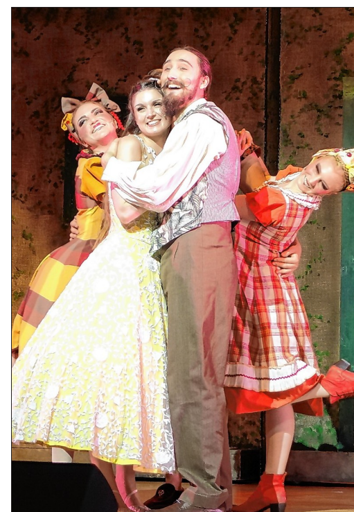
Das Ensemble des Theater Liberi zog Groß und Klein in seinen Bann.

Erst nach langem stürmischem Beifall und mehreren Verbeugungen wurden die Darsteller von der Bühne entlassen.